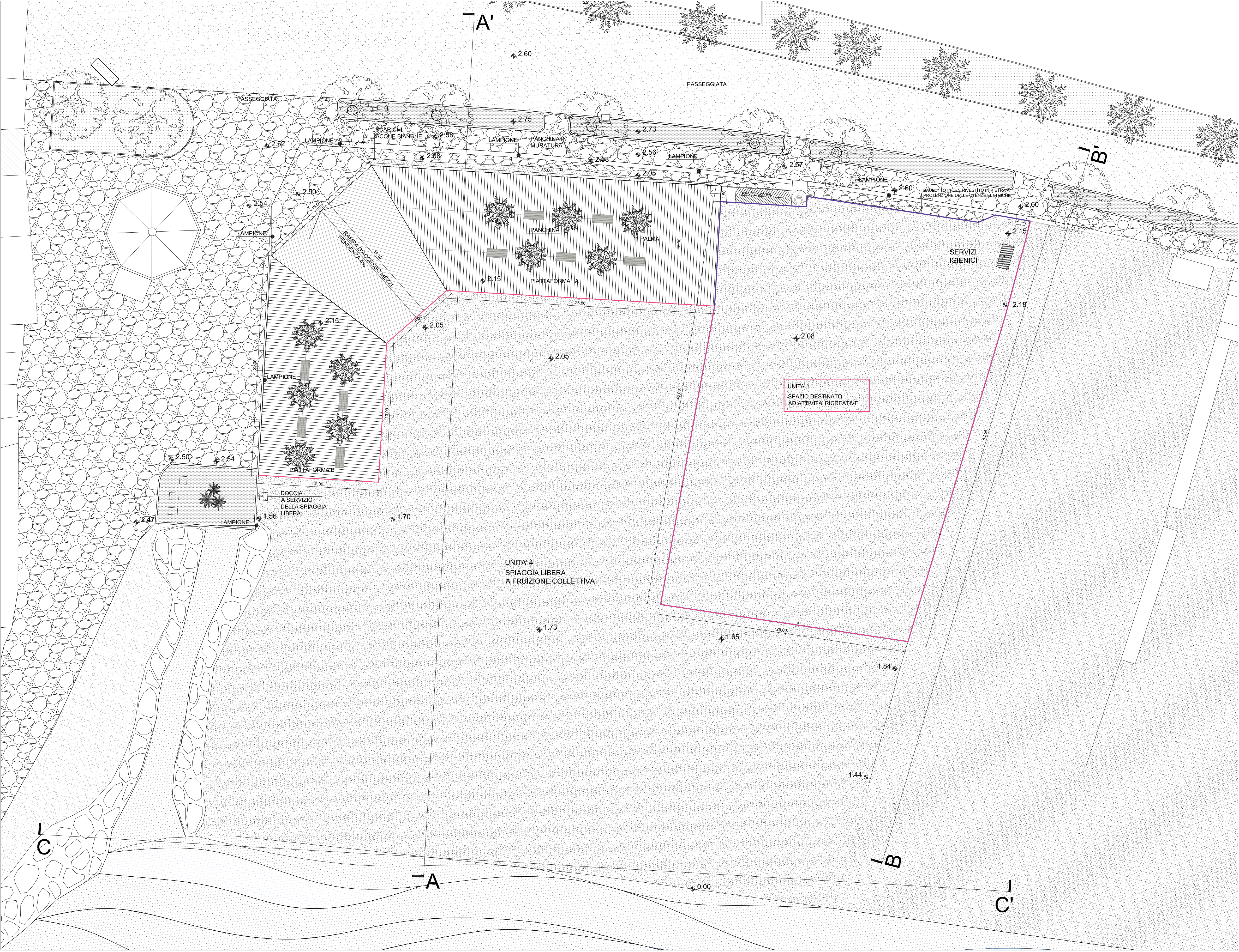
PLANIMETRIA GENERALE sc.1:200